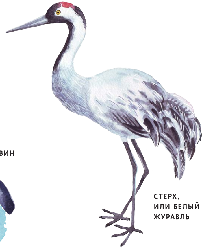
СТЕРХ, ИЛИ БЕЛЫЙ ЖУРАВЛЬ

Журавли и аисты не плавают, но пищу добывают из воды. Длинные ноги позволяют им заходить в воду и не мочить животик.