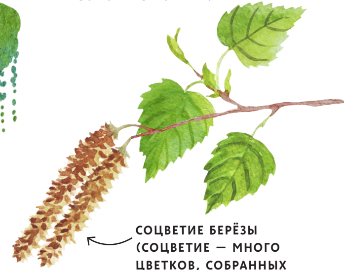
СОЦВЕТИЕ БЕРЁЗЫ (СОЦВЕТИЕ — МНОГО ЦВЕТКОВ, СОБРАННЫХ ВМЕСТЕ)

С берёзы на берёзу пыльцу переносят не насекомые, а ветер. А ему ни красота, ни запах не важны.